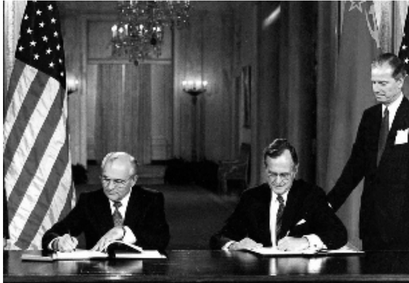
Toppmötet i Washington den 1 juni 1990 med president Michail Gorbatjov och president George H.W. Bush, och med utrikesminister James Baker till höger.

Men om den ryska invasionen inte handlade om erövringen av Ukraina, en återerövring av det ryska imperiet eller Sovjetunionen, måste vi fråga oss vad det var som utlöste den ryska invasionen.