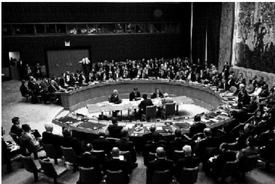
FN:s säkerhetsråd