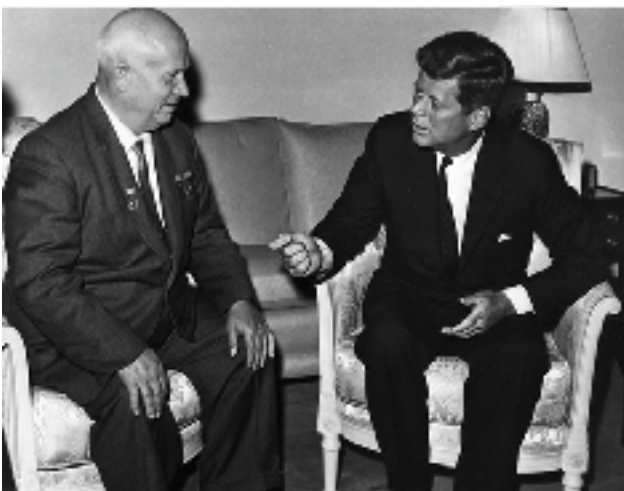
Sovjetunionens generalsekreterare Nikita Chrusjtjov och president John F. Kennedy i Wien 1961.

I fördraget står det klart och tydligt att det inte får finnas några styrkor från andra NATO-länder i det forna Östtyskland, och Moskva skulle naturligtvis aldrig acceptera någon utplacering av sådana styrkor längre österut, öster om Tyskland i "Polen och de andra länderna". Det var uteslutet, och det fanns till synes ett samförstånd mellan alla deltagare. Följaktligen "diskuterades inte frågan om NATO:s expansion", som Gorbatsjov sade 2014, eftersom det inte fanns någon oenighet. 1993 sade Boris Jeltsin att fördragets "anda" "utesluter möjligheten att utvidga NATO-zonen österut", och de muntliga åtaganden som Gorbatsjov fick av västledarna 1990-91 skulle ha fått honom att tro att det fanns ett samförstånd, och lika viktigt: dokumenterade muntliga åtaganden mellan statsledare är också juridiskt bindande.