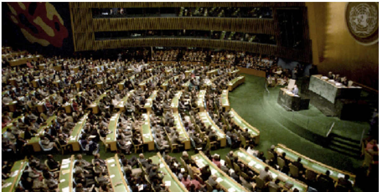
Mikhail Gorbatsjov talar inför FN:s generalförsamling 1988.

Den 10 november 2021 upprättades ett partnerskap mellan USA och Ukraina för att möjliggöra ett ukrainskt Natomedlemskap. Moskva hade sedan 2008 gjort klart att Ryssland skulle möta ett sådant medlemskap med krig. Eliten i Washington visste det. Moskva uppfattade ett sådant partnerskap som ett outhärdligt hot. Det enda skälet till en sådan amerikansk politik var att USA ville ha ett krig, vilket beskrivs i RAND-rapporten från januari 2022. Denna amerikansk-ukrainska politik är så långt ifrån FN-stadgans primära ambition att "undanröja hot mot freden" och att "upprätthålla internationell fred" som man kan föreställa sig.